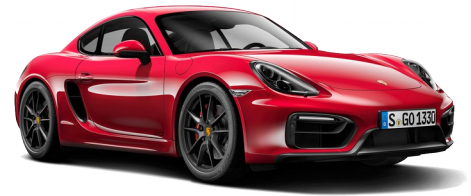
Porsche 911 V = 330 km / h