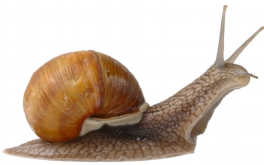
Escargot V = 1 mm / sec