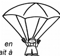
La descente en parachute se fait à vitesse constante.