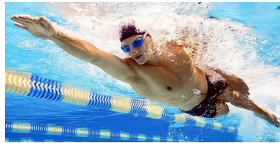
Nageur (800m) V = 1,7 m / min