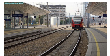
La vitesse du train diminue lors de l'entrée en gare.